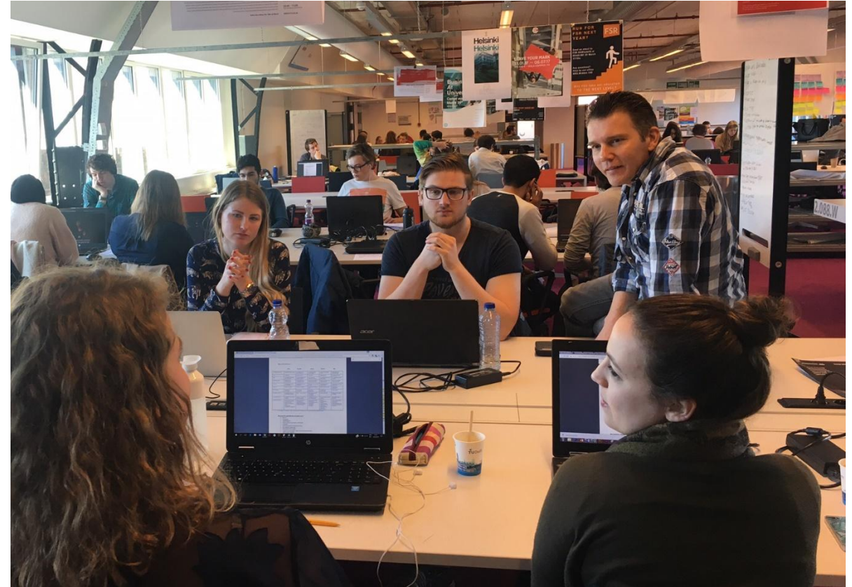
Onderhandelen en ontwerpen in de atelierruimten van de faculteit, in de huidige Corona-editie met max 3 studenten per tafel.