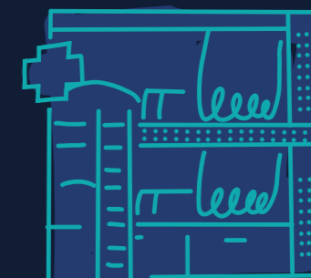
STAPELBEDDEN VAN HET RODE KRUIS