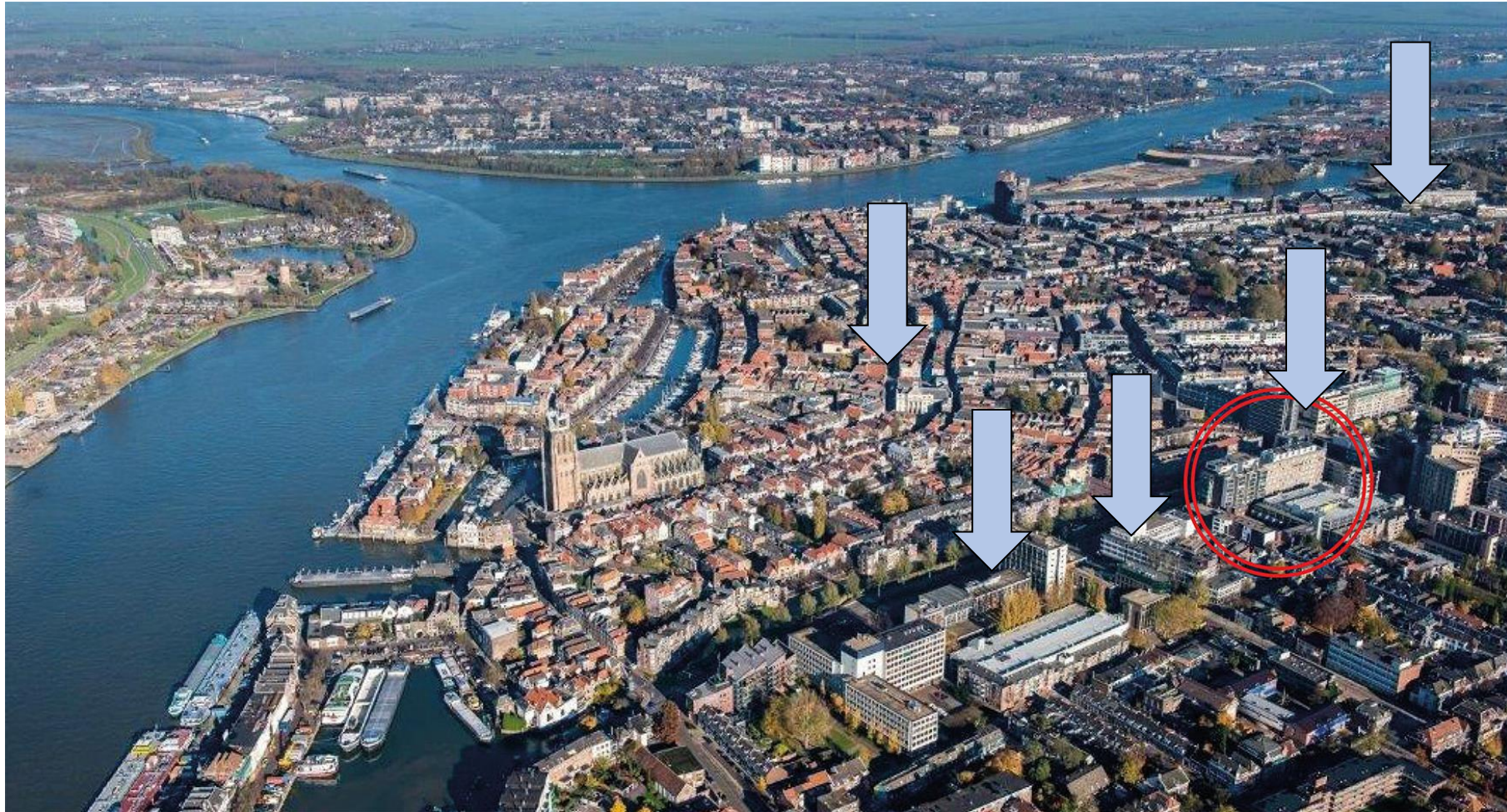
Het drierivierenpunt, de historische binnenstad en de locatie