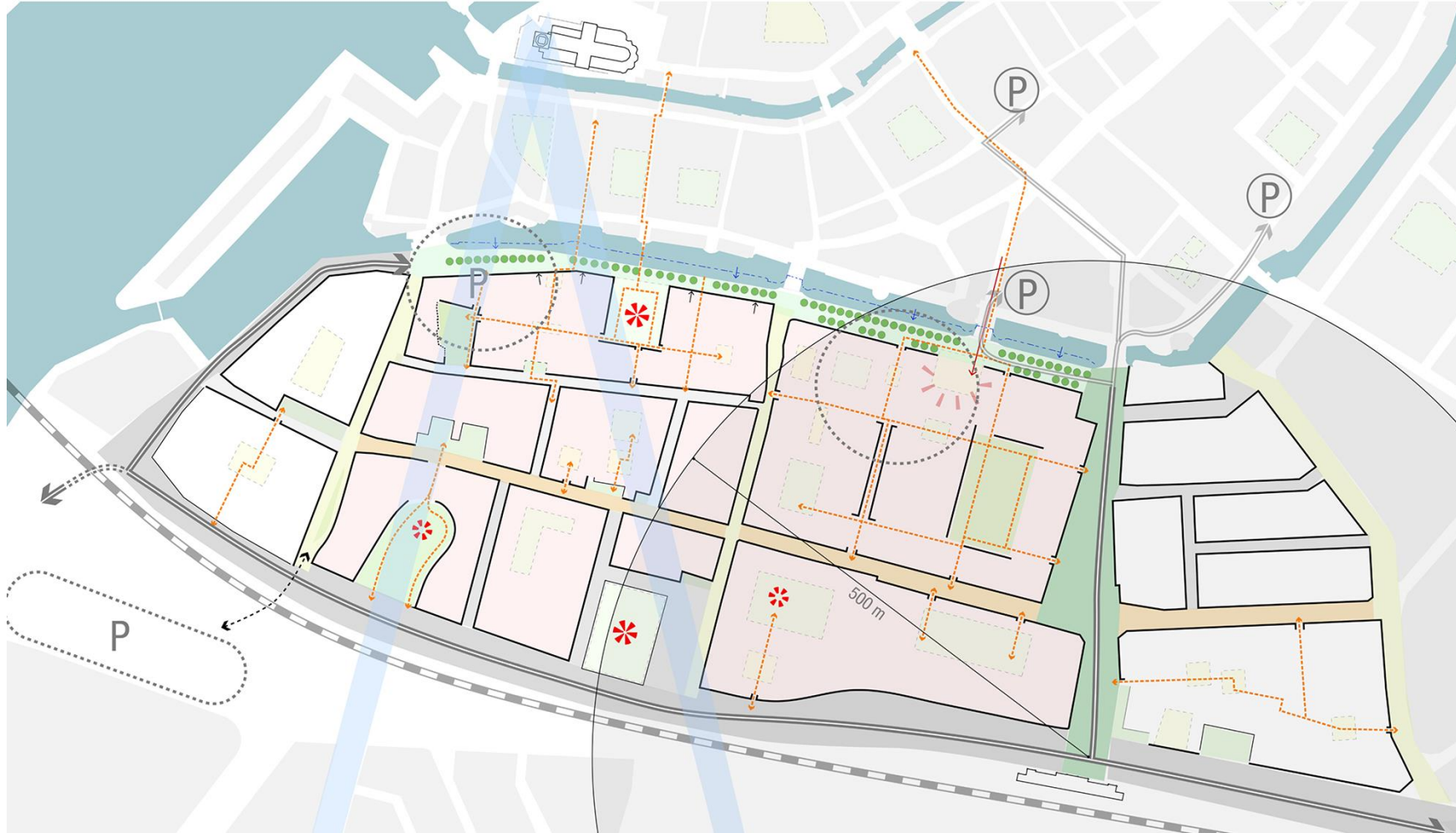
Visiekaart Gebiedsvisie Spuiboulevard e.o. (september 2018)